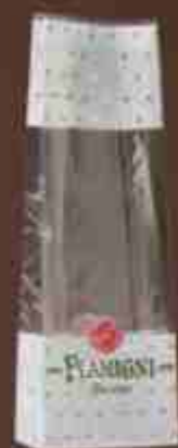
Art. 0600/A Sacchetti per sfuso Small bags for bulk Misure/Sizes: 12x6,5x35 cm