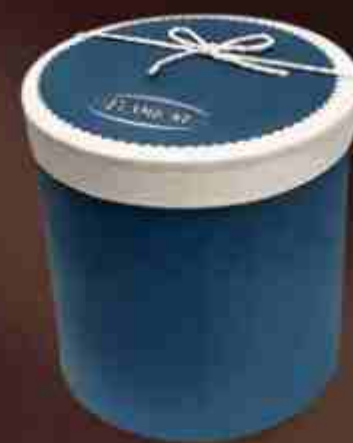
Art. 0606 Cofanetto cilindrico blu Blue cylindrical case Misure/Sizes: 20x21 cm