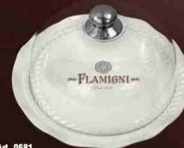
Art. 0681 Piatto ceramica con copritorta Ceramic plate with cake cover Diametro/Diameter: 40 cm