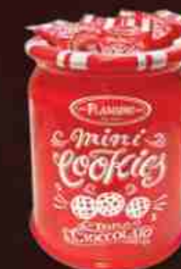
Art. 0679 Vaso in ceramica "Cookies" Ceramic "Cookies" jar Misure/Sizes: 18x21 cm