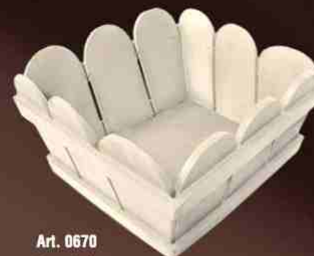
Art. 0670 Cassetta legno Wooden box Misure/Sizes: 23x23x19cm