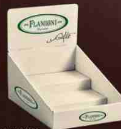
Art. 0674 Espositore per gifts Display for gifts Misure/Sizes: 28x20x25 cm