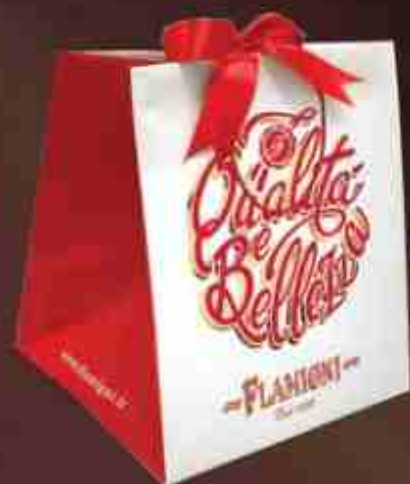
Art. 0676 Shopper con fiocco rosso Shopper with red ribbon Misure/Sizes: 34,5x40x25 cm