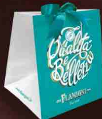
Art. 0677 Shopper con fiocco turchese Shopper with turquoise ribbon Misure/Sizes: 34,5x40x25 cm