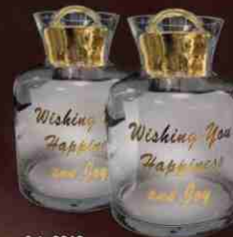
Art. 0610 Vaso vetro con tappo metallizzato Glass pot with metallized cap