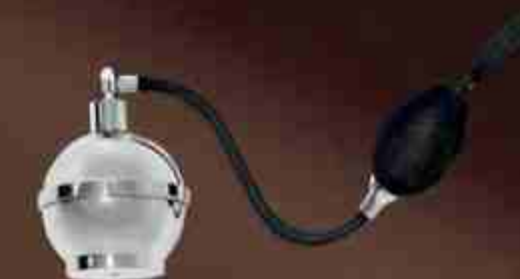
Art. 0614 Vaporizzatore per essenze alimentari Vaporizer for edible essences

I colori delle scatole sono puramente indicativi The colours of the boxes are merely indicative Etichette ingredienti da compilare da parte dell'esercente con lotto/peso/scadenza Ingredients labels to be filled in by seller with batch/weight/expiration date