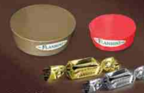
Art. 0637 Kit riconfezionamento composto da: Assorted kit containing: Torroncini morbidi ricoperti al cioccolato 1kg Small soft nougats coated with chocolate 4 Box tonde piccole - Small round boxes 4 Box tonde grandi - Big round boxes

I colori delle scatole sono puramente indicativi The colours of the boxes are merely indicative Etichette ingredienti da compilare da parte dell'esercente con lotto/peso/scadenza Ingredients labels to be filled in by seller with batch/weight/expiration date