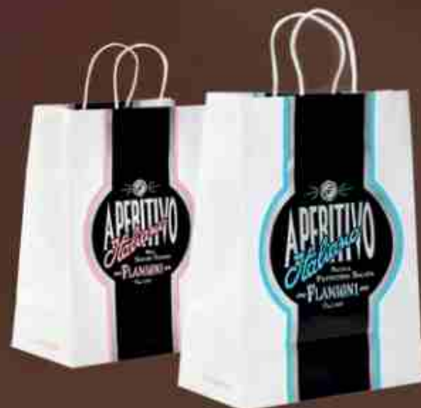
Art. 0689/R Shopper Aperitivo Italiano rosa Aperitivo Italiano pink shoppers