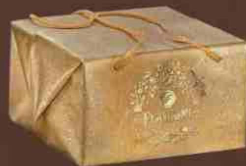
Art. 0699 Pacchetto porta panettone con manici Panettone holder box with handles