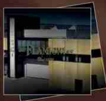
Art. 0668 Brochure Flamigni Flamigni leaflet

For a perfect presentation of our products, we offer you: